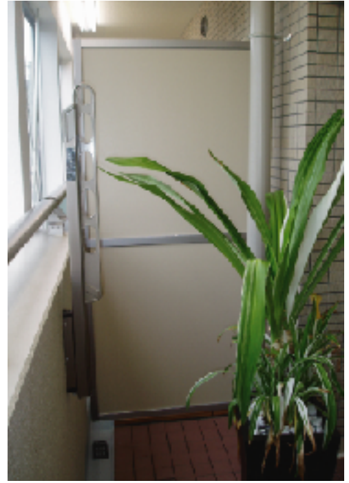
製品形状や色は印刷のため実際の製品とイメージが異なる場合があります。